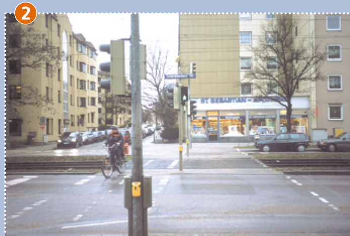
Schleißheimer-/Leonhard-Frank-Straße Fußgängerbedarfsanlage (Druckknopfampel)